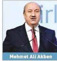
Mehmet Ali Akben

Bankacılık Düzenleme ve Denetleme Kurulu (BDDK) Başkanı Mehmet Ali Akben, küresel finans merkezleri endeksinde ilk kez 2009 yılında 72. sıradan giren İstanbul'un Eylül 2015 itibarıyla 47.'liğe yükseldiğini belirterek, "2018 yılında 25, 2023 yılında da ilk 10 içinde yer alması hedeflenmektedir" dedi.