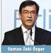
Osman Zeki Özger

Finansal Kurumlar Birliđi (FKB) Başkanı Osman Zeki Özger ; FKB'nin kuruluşundan bugüne kadarki 3 yıllık sürede temsil ettiđi sektörlerin ekonomideki payının büyümesi, insan kaynađı kalitesinin artırılması ve Türkiye'nin 2023 hedeflerine katkı sunmaya yönelik projelerinin