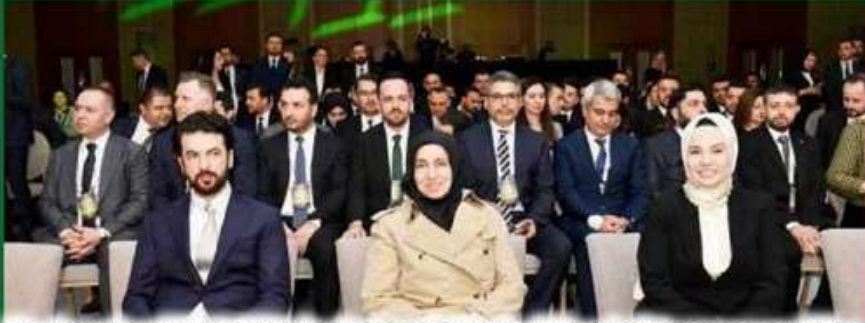
Eminevim "Elbirliğiyle Gelecek Emin Ellerde" teması ve ülke çapındaki 119 şubesinde görev yapan yöneticileriyle 2024 strateji toplantısını İstanbul'da gerçekleştirdi.